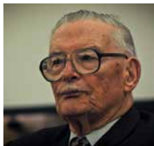
James M. Buchanan foi um dos principais mentores da versão mais radical do capitalismo, o neoliberalismo