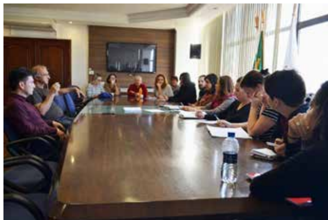
Vocês vão ver o que é autoritarismo quando discutir o PCCV, disse Hissam

O anúncio de mexer nos planos de carreiras e a sequência de medidas arbitrárias colocaram os servidores em Estado de Greve. A categoria está mobilizada e pronta para resistir aos ataques que virão.