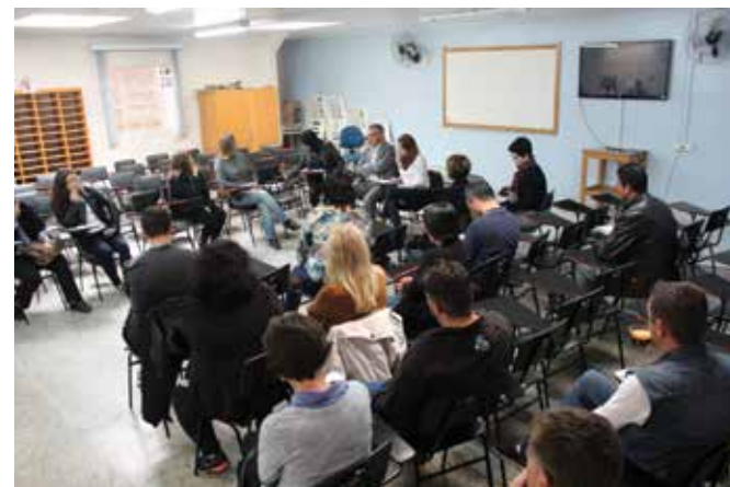
Professores da Docência II criaram coletivo para defender seus direitos no processo de estadualização

Nas reuniões, o Ministério Público cobrou do Estado a inclusão de mais ou menos 100 alunos do 6º e 7º anos