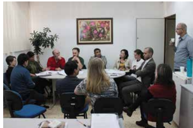
Muitas conversas sem avanços definem os 7 meses da gestão Hissam

Foi uma ducha fria em quem ainda acreditava em nobres intenções por parte do prefeito. O projeto 1999/17 significava que não haveria mais negociações para o pagamento da dívida das promoções e progressões. Que cada